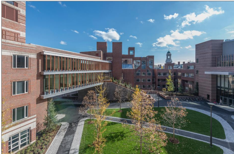
[그림1] 하버드 케네디 스쿨 캠퍼스 전경

HKS는 미국 행정학 발전사의 핵심적인 순간에 등장했다. 1929년 경제대공황 이전까지 미국은 '작은 정부'를 추구했다. 행정은 집행, 정치는 판단의 기능을 수행한다고 주장하는 정치-행정